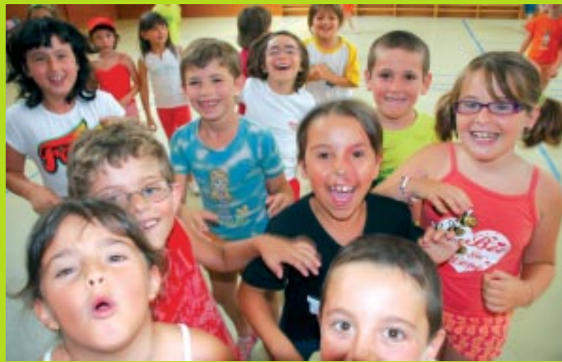
L'equip de TV10

Com cada any, l'Estevestiu TV seguirà diàriament les activitats dels casals. El programa s'emetrà del