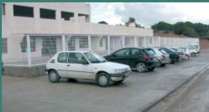
Pavimentació provisional de la vorera de la nova escola.

Després que el passat 11 de setembre entressin en funcionament les aules d'infantil de la nova escola, les obres de construcció han continuat amb la part de primària. L'equipament educatiu es completarà amb una zona esportiva. Segons les previsions del Departament d'Educació de la Generalitat,