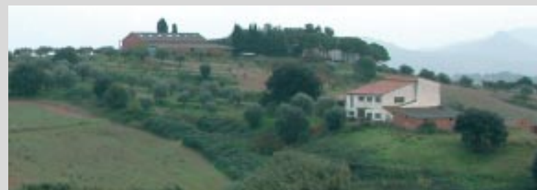
La masía de Can Serra está rodeada de un entorno privilegiado.

Una vez finalice el proceso administrativo para la reubicación de Chupa Chups se hará efectiva la cesión gratuita de las masías de Can Serra y Can Domènech, que pasarán a ser de titularidad municipal. Inicialmente, Can Serra era una de las posibles ubicaciones previstas por el equipo de gobierno para acoger la residencia y centro de día. Pero para que fuera viable, era necesario que el proceso terminara satisfactoriamente, como así ha sido.