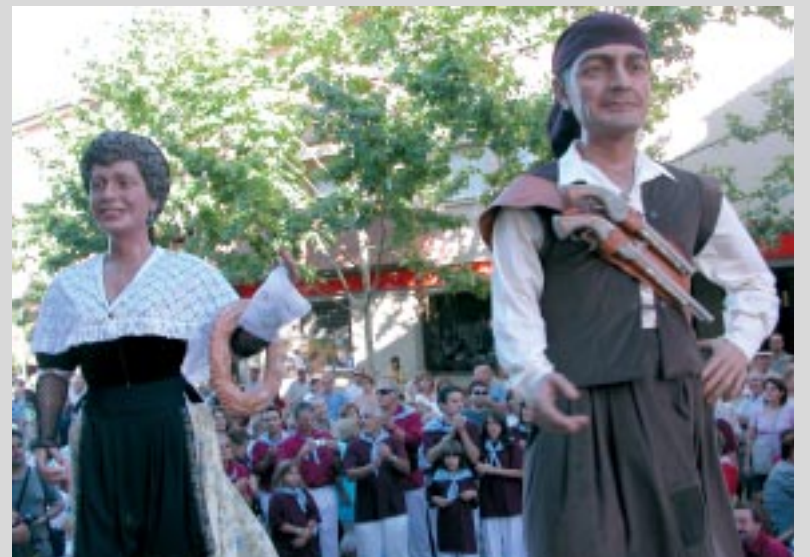
En Siset i l'Angeleta van ballar durant la Trobada de Puntaïres.

El tradicional Ball de Garlandes que se celebra el Dia de Sant Esteve comptarà, en aquesta ocasió, amb una parella especial. En Siset i l'Angeleta, els gegants de Sant Esteve, exerciran per primera vegada com a parella de ball en aquesta dansa tan arrelada al nostre municipi. De fet, l'Angeleta llueix el vestit tradicional d'aquest ball i duu una garlanda al braç esquerre. No sabem però, si com diu la tradició, va ser en Siset qui, com a bon minyó, va obsequiar-la amb el pa rodó o tortell.