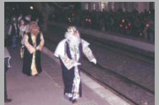
Arribada en tren de vapor, l'any 2003.

Els Reis d'Orient, Melcior, Gaspar i Baltasar, han decidit tornar a fer servir el tren de vapor per arribar a Sant Esteve. L'entrada del comboi a l'estació està prevista a les 18.00 hores. Ses Majestats ja han utilitzat aquest mitjà de transport en anteriors ocasions, la darrera l'any 2003. El Patronat Municipal ha repartit fanals a les escoles per tal que els infants puguin oferir-los una calorosa benvinguda. La cavalcada començarà a l'estació i passarà per l'avinguda Francesc Macià, el carrer de l'Alba, farà la tradicional parada a l'Ajuntament, continuarà per l'avinguda Montserrat, el passeig de les Oliveres, fins arribar a la Pista, on els infants que ho desitgin podran donar als Reis les seves cartes. Ses Majestats faran servir les espectaculars carrosses que van estrenar l'any passat. A partir de les 20.00h, els seus patges començaran a repartir regals per les cases de Sant Esteve.