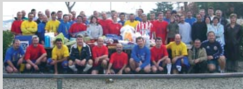
El partit de Nadal de 2004 va reunir participants i autoritats.