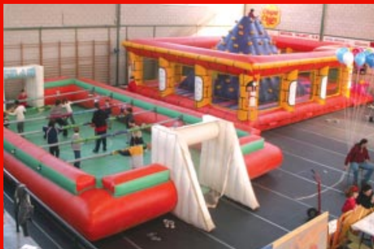
El Pavelló Poliesportiu Municipal acollirà les activitats del Jovinfant.

L'edició d'enguany del Jovinfant, el saló de la infància i la joventut, tindrà el món del mar com a eix temàtic. En aquesta ocasió s'ha volgut reforçar l'oferta destinada als joves de 12 a 16 anys amb activitats com rocòdrom, jumping, playstations, ordinadors i quads i, a més, el calendari ha permès ampliar-lo dos dies. Per als més menuts també hi haurà propostes lúdiques molt atractives com ara inflables, tallers, karaoke o maquillatge.