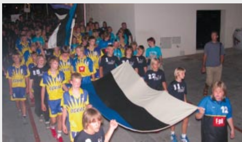
Un desfile de los equipos participantes abre el torneo.

Más de 100 equipos y más de 1.000 participantes de distintos países