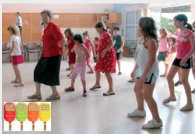
Esta actividad tuvo mucho éxito el año pasado.

Después del éxito conseguido en la edición anterior, la actividad «Juguem grans i petits» convertirà el Casal de la Gent Gran en punto de encuentro intergeneracional. Será el próximo 27 de julio, a partir de las 11 de la mañana. Se trata de un espacio con diferentes talleres (juegos, manualidades y cocina) dirigidos a niños de 6 a 12 años de edad. Las actividades cuentan con unos monitores de excepción, personas del Casal de la Gent Gran dispuestos a compartir sus experiencias con los más pequeños.