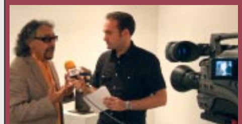
CANAL FESTA MAJOR TV a partir del 21 de juliol

Consulta tots els actes a www.sesrovires.net