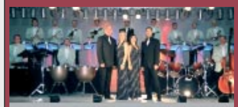
orquestra MONTGRINS dissabte 29