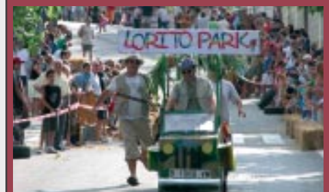
4a baixada de carretons dissabte 29