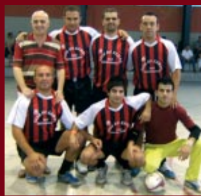
Equip guanyador del torneig.

També dins el marc de la Festa Major, tot i que ja ha finalitzat, s'ha disputat el tradicional Torneig de Futbol Sala. El passat 15 de juliol l'equip Casa de Campo va proclamar-se campió de la 26a edició d'aquesta competició que enguany ha comptat amb la participació de 16 equips.