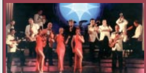
orquestra VOLCAN divendres 28