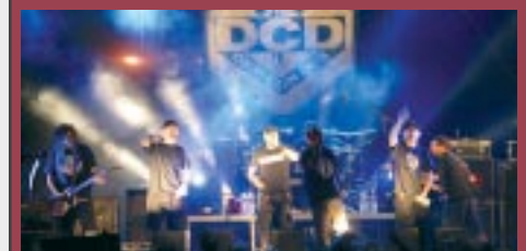
concert DEF CON DOS dissabte 29