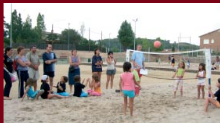
Els més petits també gaudeixen de la pràctica del vòlei platja.

VÒLEI. Després de l'èxit del Torneig d'Estiu de Vòlei, en què hi participen més de 50 equips i prop de 250 jugadors, El Club de Vòlei organitza pel proper 29 de juliol les 12 hores de vòlei platja 3x3 a les pistes instal·lades al camp de futbol-7. Les inscripcions poden fer-se a les mateixes pistes, de dilluns a divendres, de 18.00 a 20.00h.