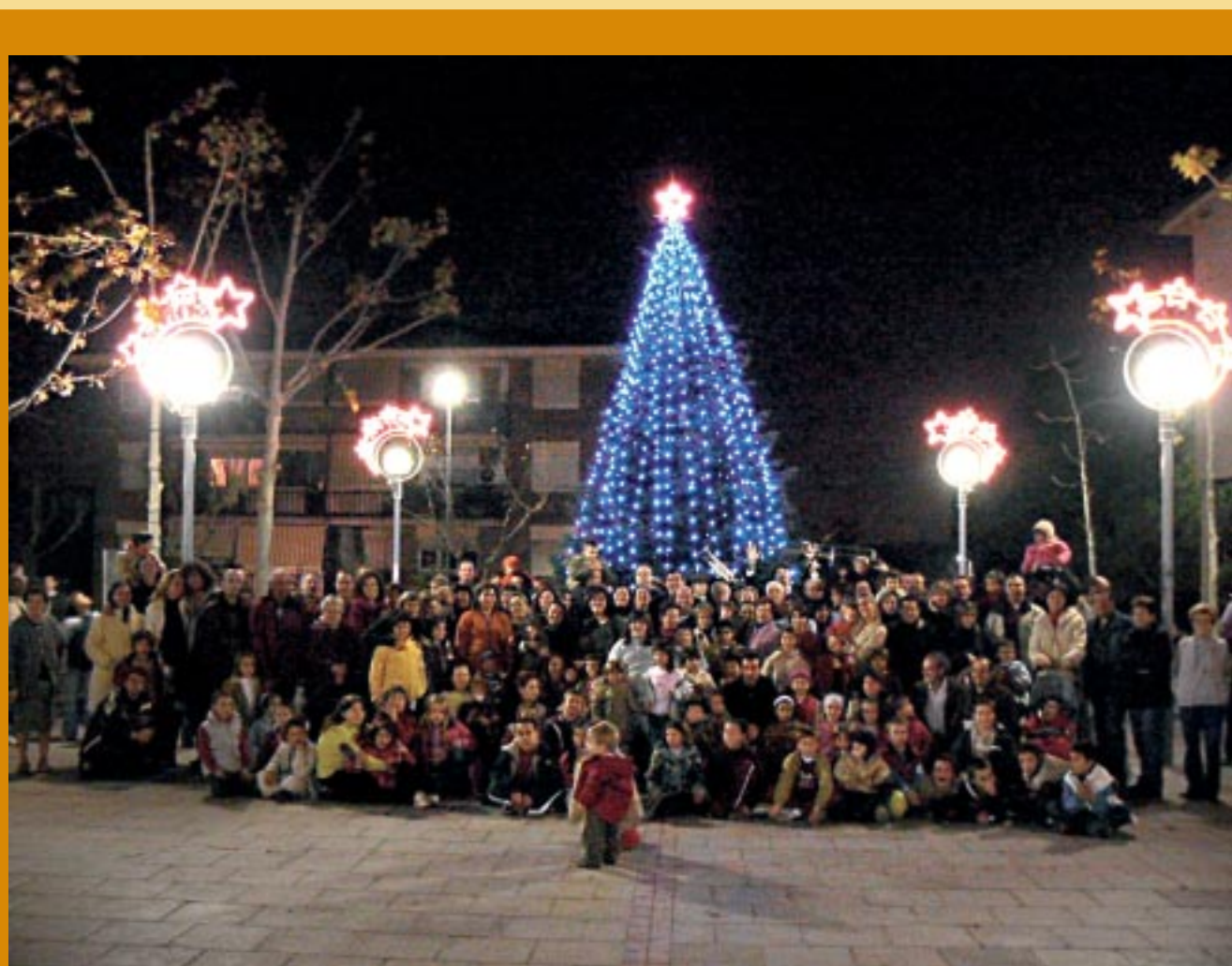
Molts sesrovirnecs es van reunir al voltant de l'avet nadalenc de la plaça Xic Mateu.

I a totes les llars sesrovirenques, com també ja és tradició, arribarà el calendari que any rere any edita l'Ajuntament. Les imatges que l'il·lustren són obres de diverses edicions del Concurs de Pintura Ràpida que se celebra en el marc dels actes de la Festa Major. Els quadres seleccionats mostren diferents indrets del municipi i diverses tècniques plàstiques.