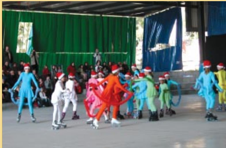
El Festival de Patinatge de Nadal serà un dels actes de La Marató .

de la Coral Infantil del 23 de desembre també estarà destinat a La Marató .