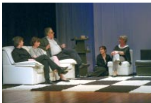
L'Ull de Bou amb l'obra Maror .

El 13 de gener arrencarà aquest cicle teatral que reuneix companyies del món teatral tant professional com amateur.