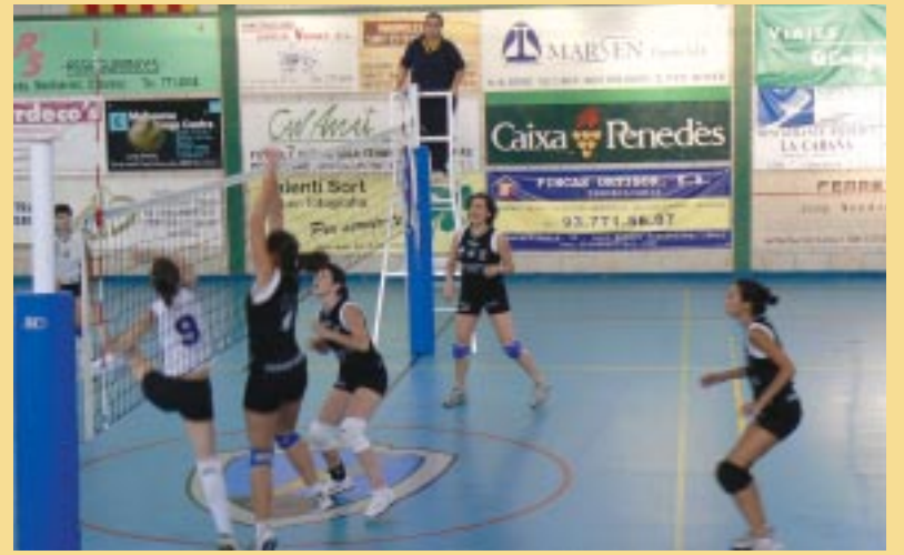
El deporte servirà para recaudar dinero para buenas causas.

Durante las fechas navideñas, la actividad deportiva local sustituirá la competición por la solidaridad.