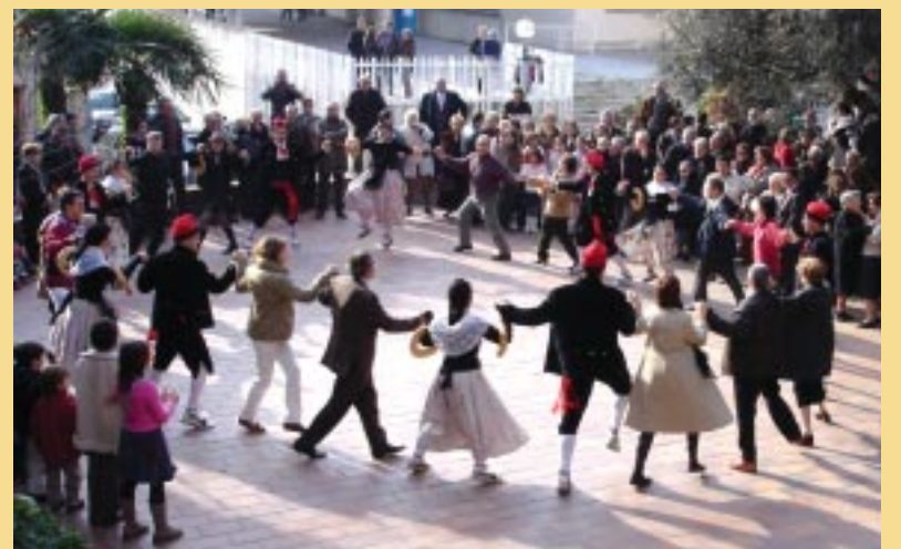
El Ball de garlandes se celebra per Sant Esteve.

Coincidint amb la celebració de Sant Esteve, el proper 26 de desembre la plaça de la Vila serà escenari del tradicional Ball de garlandes.