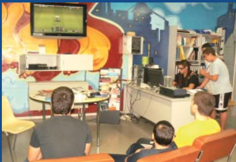
Torneig de Pro-Evolution Soccer durant la Tardor Jove'08.

L'oferta lúdica abarca des de torneigs de Play Station (Pro-Evolution Soccer, Sing Star i GT) a propostes cinematogràfiques de diferents gèneres (terror, humor i animació).