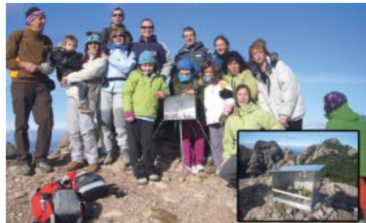
El pessebre al Cim Albarda Castellana.

El GIREs va col·locar un pessebre el passat 30 de novembre al cim Albarda Castellana, que amb 1.167 metres d'altitud està considerat el sostre del Baix Llobregat. Un total de 38 persones van participar en aquesta iniciativa nadalenca organitzada per l'entitat local.