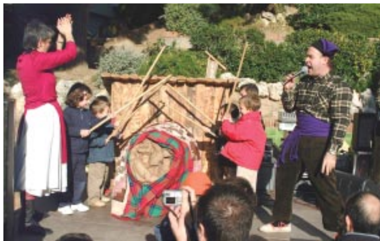
Torna el cagatió tradicional, el 24 de desembre, a la tarda.

Per poder accedir la tarda del cagatió al pavelló, serà imprescindible que els infants vagin acompanyats per un adult.