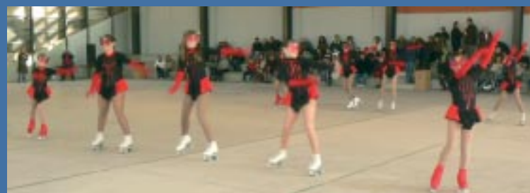
El Festival de Patinatge es farà a la Pista Coberta.

Les festes nadalenques també tindran enguany un component esportiu important. Així, l'Escola Municipal de Patinatge Artístic oferirà el Festival de Patinatge de Nadal, el 20 de desembre, a la Pista Coberta.