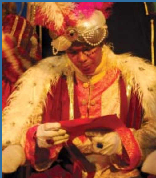
El rei Baltasar llegeix la carta d'un nen sesrovirenc.

Baltasar, en nom dels tres Reis d'Orient, ha mantingut una conversa pel Messenger amb el Patronat Municipal i ha expressat el desig de Ses Majestats de rebre les cartes dels infants de Sant Esteve a la plaça del Dr. Tarrés, un cop acabi la cavalcada. Es recupera, doncs, una antiga tradició, atès que aquest ja havia estat fa uns anys l'indret on acabava.