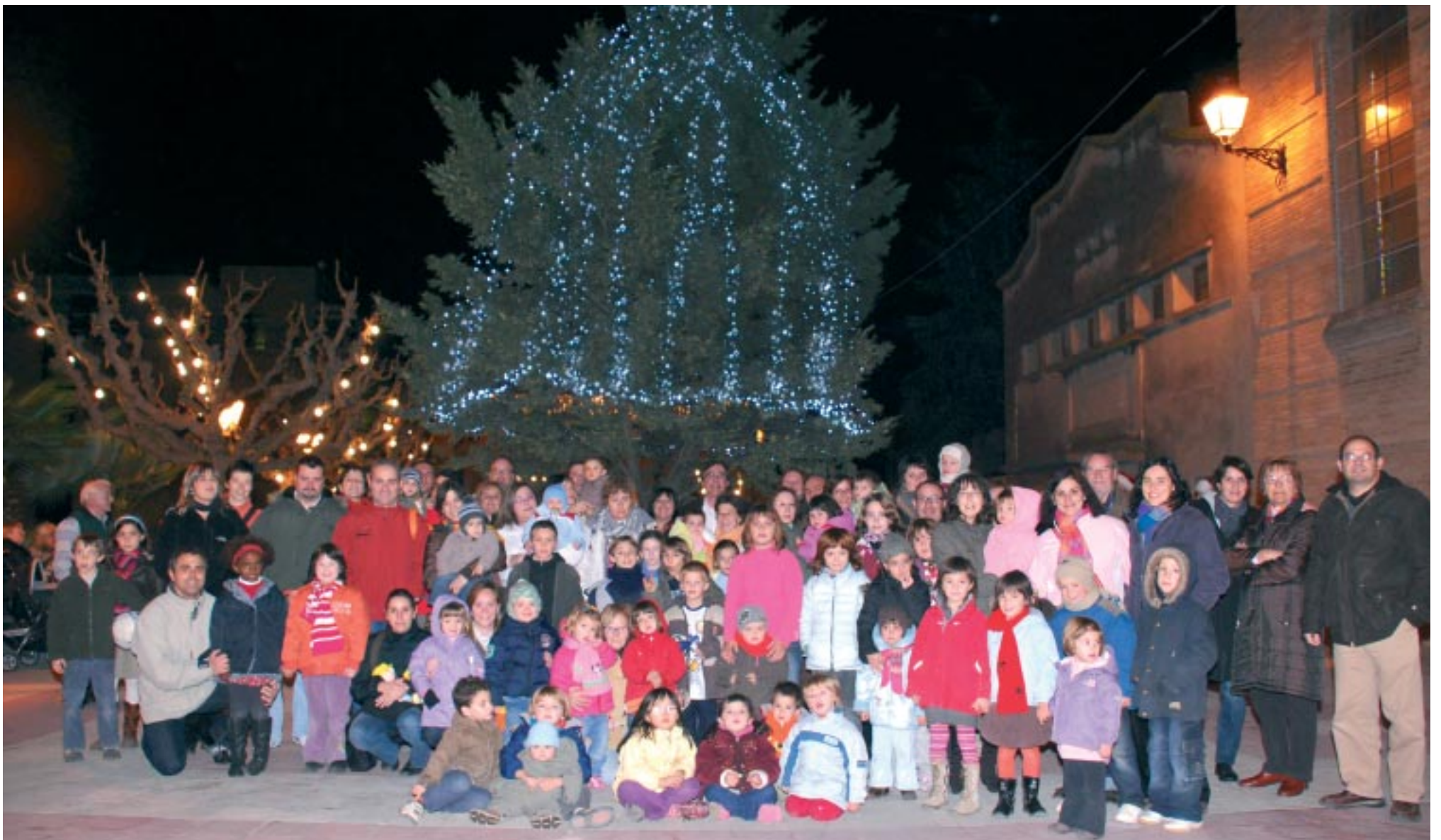
Foto de grup davant l'arbre de Nadal, el dia de l'encesa de llums.