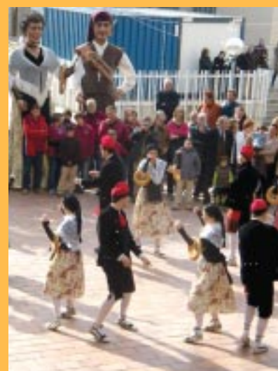
El Ball de Garlandes és la tradició folklòrica i coneguda de Sant Esteve i encara es manté viva.

Per conèixer aquesta tradició sesrovirenca, durant els mesos de novembre i desembre, l'Àrea de Cultura del Patronat ha organitzat un curs impartit per membres de l'esbart.