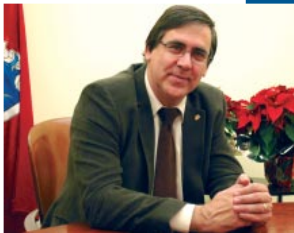
ENRIC CARBONELL Alcalde de Sant Esteve