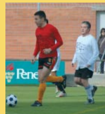
El partit, el 26 de desembre.

Un any més, la Peña Blaugrana de Sant Esteve s'adhereix i col·labora amb la campanya «Fem un món millor», de la Creu Roja. Per aquest motiu convoca el tradicional partit de Sant Esteve, el 26 de desembre, a les 11.00h, al Camp de Futbol Municipal, amb l'objectiu de recollir joguines (noves o d'un valor mínim de 6 euros) per a nens sense recursos.