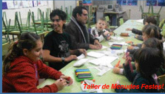
Taller de Menudes Festes!