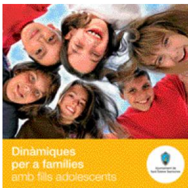
Dinàmiques per a famílies amb fills adolescents

Amb l'objectiu de cercar recursos per afavorir les relacions personals i familiars a pares i mares amb fills adolescents a través de la comunicació i les reflexions compartides, des de les àrees d'Educació i de Benestar Social s'ofereix la 3a edició del cicle Dinàmiques per a famílies amb fills adolescents. La iniciativa compta amb la col·laboració de l'AMPA i de l'Institut Josep Fusalba.