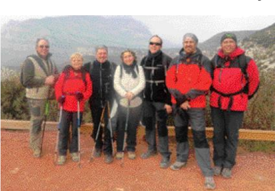
El GIRES a Sant Salvador de les Espases.

El GIRES va tancar el 2011 col·locant un pessebre a l'Albarda Castellana, el cim més alt del Baix Llobregat, i ha començat l'any amb una excursió a Sant Salvador de les Espases i a Llançà. Per al 12 de febrer té previst una matinal al Parc Canals i Nubiola, que finalitzarà amb un dinar. La inscripció es pot fer al local de l'entitat.