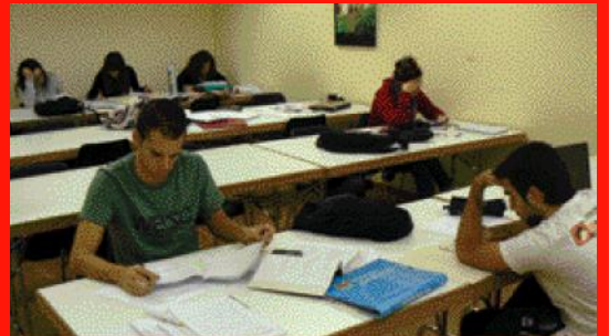
L'Aula obre els caps de setmana de 17.00 a 00.00 hores

L'Aula d'Estudi Nocturna, que va obrir el 9 de gener i que estarà en funcionament fins al 4 de març, ha ampliat el seu horari de funcionament els caps de setmana. L'Àrea de Joventut ha decidit modificar els horaris a petició dels propis joves que així ho han demanat a través de la bústia de suggeriments que hi ha a la mateixa aula.