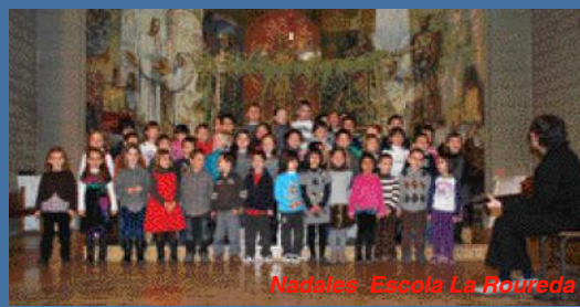
Nadales - Escola La Roureda