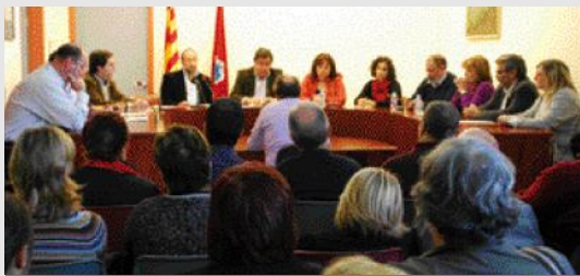
Sessió plenària celebrada el passat 30 de novembre.