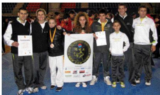
Els sesrovirencs, en el Campionat de Clubs d'Espanya.

La presentació del Club Taekwondo Sesrovires va deixar sense seients lliures el Pavelló Poliesportiu el passat 4 de desembre. El nombrós públic va seguir amb atenció la demostració de tècniques