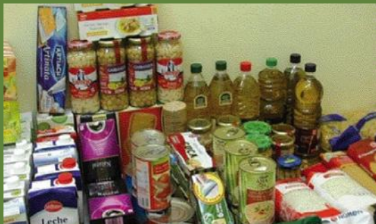
En total es van recollir 1.265 quilos de productes.

Des del Banc d'Aliments s'agraeix la implicació de tots els que han fet possible aquest èxit global i es vol destacar la implicació tant de les col·laboracions individuals com dels punts de recollida: les parròquies de Sant Esteve i de La Beguda; els comerços locals;