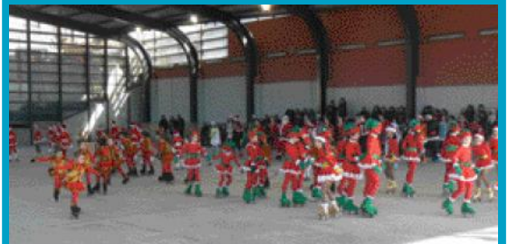
La temàtica nadalenca va ser l'element comú de les coreografies.

Més de 80 patinadors i patinadores van participar en el Festival de Patinatge de Nadal que va oferir l'Escola Municipal de Patinatge Artístic el passat 17 de desembre a la Pista Coberta Francesc Castellat. Dotze coreografies van formar aquest espectacle.