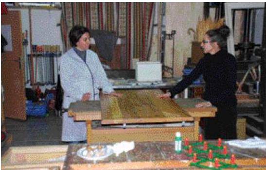
El nou espai disposa de més mitjans tècnics.

El taller municipal de restauració de mobles s'imparteix des del mes de gener a Ca n'Amat. El nou espai permet als 16 alumnes del curs disposar d'un lloc més ampli i amb més eines, màquines i bancs de treball.