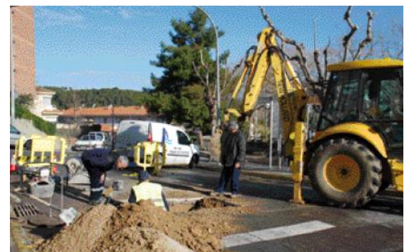
Operarios instalando el regulador de presión.

Aigües de Catalunya, la empresa que gestiona el servei y la red de suministro de agua del municipio ha realizado durante el mes enero unas actuaciones de mejora en la zona de La Gleva y Vinya La Passada. Los trabajos, que han consistido en la instalación de un regulador de presión, forman parte del Plan Director del Agua de Sant Esteve. Durante la ejecución de la obra se detectó una fuga en la red general que ya ha sido reparada.