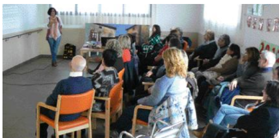
La formació es va impartir al Centre de Dia de Can Serra.

Prop d'un trentena de persones van participar el passat dia 14 en una jornada de formació adreçada principalment als voluntaris que participen en el projecte "Tens una hora a la setmana?". També van assistir-hi cuidadors i alumnes del curs sobre Atenció a malalts d'Alzheimer que s'imparteix a l'Aula Municipal de Formació.