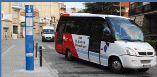
El servicio de la línea-2 deja de prestarse temporalmente.

La decisión se ha debido a la escasa demanda de usuarios en esta línea, que en el actual contexto no justifican su mantenimiento. El coste anual de la línea es de unos