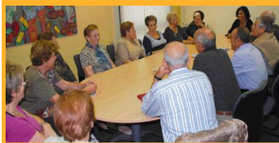
Reunió de la Comissió de la Gent Gran.

Des d'aquest curs, L'Espai Obert ofereix també un Servei de reforç escolar on assisteixen 16 alumnes.