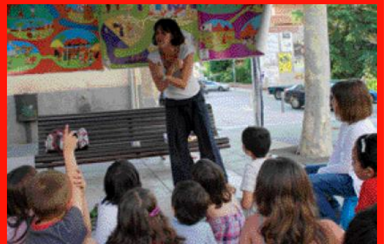
Les inscripcions són del 13 al 24 de febrer.

Saber explicar una història és un eina molt útil quan es vol dinamitzar un grup de nens i nenes. L'Àrea de Joventut ha programat la Jornada Compartida Explica'm un conte adreçada a monitors i premonitors que vulguin aprendre aquest mitjà educatiu. El curs s'impartirà el 24 i 25 de març. Les inscripcions s'han de realitzar del 13 al 24 de febrer al SIAC.