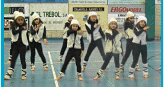
El Festival es va celebrar al Pavelló Poliesportiu.

L'Escola Municipal de Dansa-Jazz va oferir el 18 de desembre al Pavelló Poliesportiu el seu primer Festival de Nadal. Les onze coreografies van estar ambientades en elements típics d'aquestes festes, com ara pastorets.