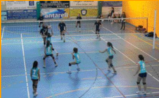
Van prendre-hi part equips juvenils, cadets i infantils.

El Club Vòlei Sant Esteve va organitzar els dies 4 i 5 de gener la segona edició del Torneig Voleibol Base de Nadal al Pavelló Poliesportiu, en el qual van participar equips juvenils, cadets i infantils de la Vall d'Hebron, FC Barcelona, Molins de Rei, Olot, Sant Just, Monjos, Sant Boi i Vilassar, així com els del CV Sant Esteve.