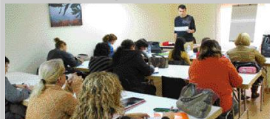
Les classes van començar el passat 28 de novembre.

El curs sobre Atenció Especialitzada a Malalts d'Alzheimer, organitzat per l'Àrea de Promoció Econòmica i subvencionat pel SOC i el Fons Social Europeu, es troba en el tram final. La formació acabarà amb unes jornades pràctiques que tindran lloc entre el 6 i el 23 de febrer. La quinzena d'alumnes hauran de realitzar 84 hores de pràctiques, 7 hores faran a Can Serra i la resta al Canigó d'Abrera.