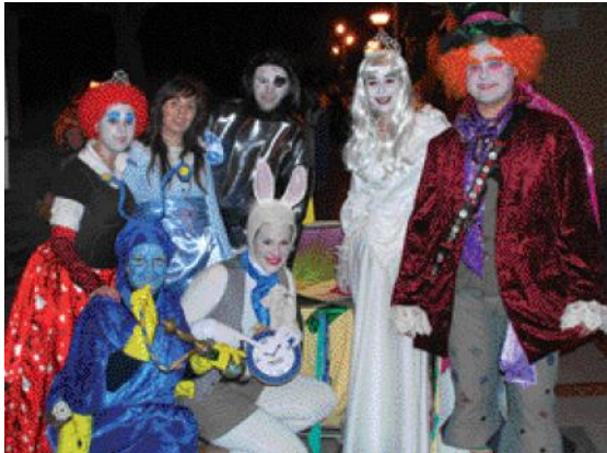
Les comparses s'han d'inscriure prèviament al SIAC.

Però el regne de sa majestat Carnestoltes acabarà a l'aparcament del Pavelló