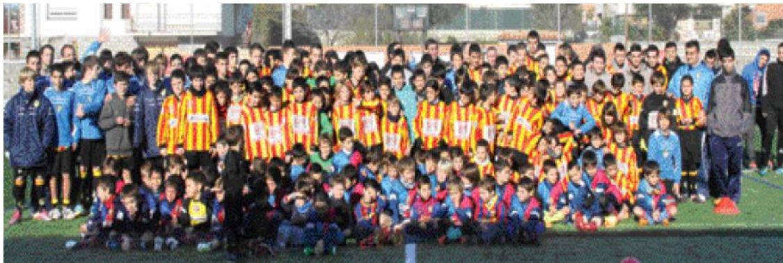
Els equips del FC Sant Esteve de la temporada 2011-12.

El públic va omplir la graderia del Camp de Futbol Municipal el 18 de desembre per veure la presentació dels equips del FC Sant Esteve i de l'Escola Municipal de Futbol per a la present tempore-