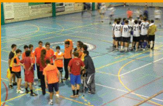
Van participar-hi equips de totes les categories.

El Club Handbol Sant Esteve va celebrar una nova edició del Torneig Social Nadalenc el passat 18 de desembre al Pavelló Poliesportiu, i en el qual van participar els equips de totes les categories de l'entitat, des dels jugadors de minihandbol fins als veterans.