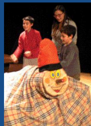
300 nens van passar pel Caga tió

Els tallers de contes van ser alguns dels de més èxit. També el Caga tió va registrar molta assistència, ja que més de 300 nens van picar l'esquena del tió. Així mateix, el patge Viu-Viu va quedar molt content, ja que va rebre al voltant de 170 cartes dels nens de Sant Esteve per a Ses Majestats. Una altra de les propostes reeixides va ser el taller d'educació vial de la Policia Local.