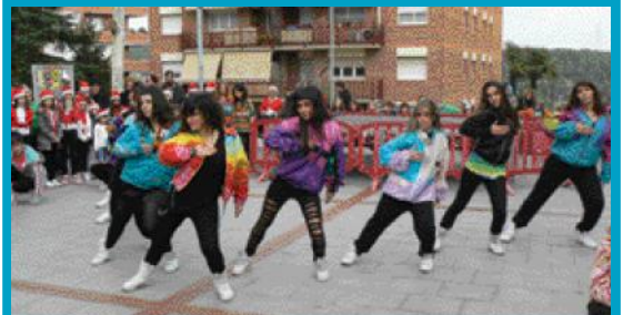
Es van ballar tant temes moderns com altres típics del Nadal.

La plaça Xic Mateu va acollir el 24 de desembre una masterclass de l'Escola Municipal de Funky-Hiphop. S'hi van oferir tant coreografies basades en temes actuals, com els de Jenifer López, com d'altres més clàssics del Nadal.