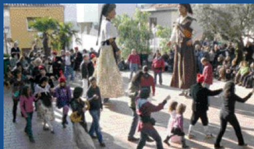
Els gegants van estrenar una nova coreografia.

El tradicional Ball de Garlandes també va innovar, ja que la colla gegantera va estrenar una nova coreografia per al Siset i l'Angeleta.