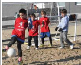
Campus de futbol.