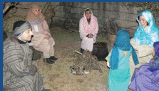
El pessebre vivent va rebre 600 visitants.

Les passades Festes d'Hivern han combinat la recuperació d'elements típics de la tradició nadalenca amb noves propostes culturals. Després de nou anys sense fer-se, la nova edició del Pessebre Vivent ha comptat amb el suport del públic. Més de 600 persones es van apropar a la plaça Rosa Comajuncosa per visitar els quadres que conformen aquesta representació costumista.