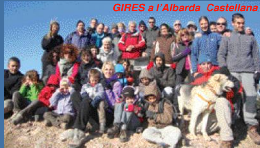
GIRES a l'Albarda Castellana