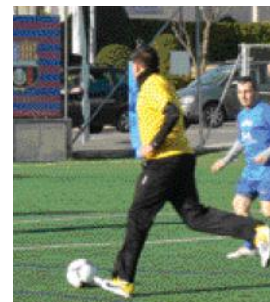
S'hi van recollir 200 joguines.

La Penya Blaugrana va recollir 200 joguines durant el Partit de Nadal, una iniciativa a favor de la Campanya Cap nen sense joguina de la Creu Roja. Uns 50 jugadors van participar en aquesta iniciativa solidària celebrada el 26 de desembre al Camp de Futbol Municipal.