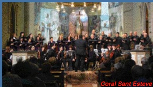
Coral Sant Esteve