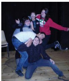
Taller de teatre social.

L'Àrea de Benestar Social va impulsar aquest servei que es va posar en marxa l'any 2007. Des de llavors, ha tingut una evolució molt positiva en el nombre d'assistents. Actualment hi participen 50 infants i joves, molt per