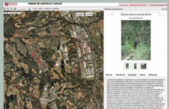
Fitxa de la Font del Capellà, que pot trobar-se al web municipal.

El proper 1 de febrer la Sala Domènech i Estapà acollirà la presentació pública del Mapa de Patrimoni Cultural de Sant Esteve, a partir de les 19.30h. L'acte, obert a tothom, comptarà amb la participació de membres de l'equip de la Diputació que ha dut a terme aquest inventari que recull la riquesa dels béns culturals i naturals del nostre poble. En el decurs de la presentació s'explicarà, entre altres aspectes, la metodologia que s'ha seguit per elaborar el document.