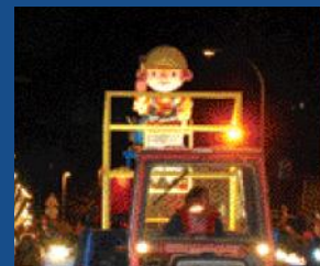
La carrossa dels trabucaires.