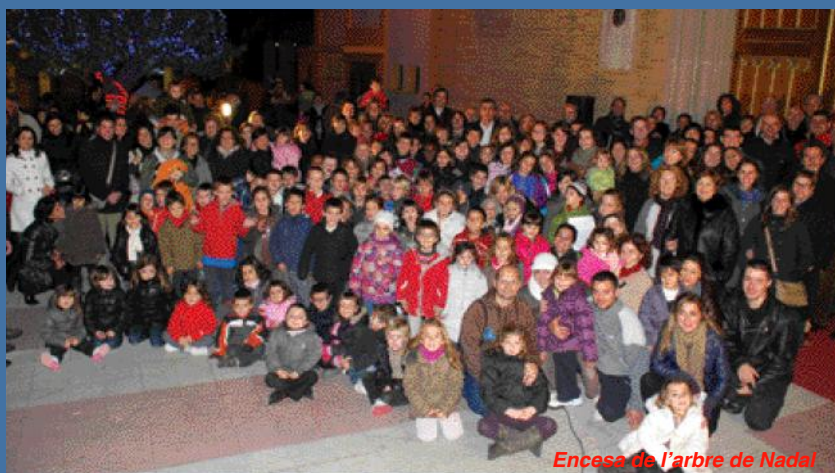
Encesa de l'arbre de Nadal