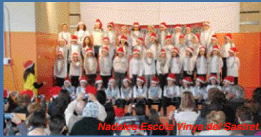
Nadales Escola Vinya del Sasret