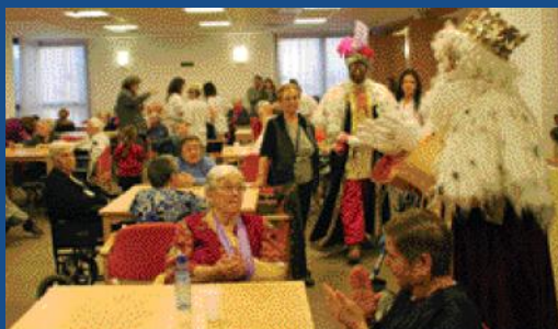
Els Reis d'Orient van visitar els residents de Can Serra.

Algunes de les novetats han vingut de les mans de Ses Majestats d'Orient. La visita dels tres Reis a la residència de Can Serra va omplir d'il·lusió els residents, molts d'ells acompanyats dels seus néts i familiars. L'emoció va posar més d'una llàgrima als ulls dels avis.