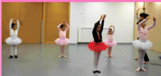
Les classes s'imparteixen a La Ginesta.

Al voltant d'unes 40 persones van assistir a la jornada de portes obertes que l'Aula de Dansa Clàssica va oferir el passat 20 de desembre a la Llar d'Infants Municipal La Ginesta, espai on s'imparteix aquesta forma d'expressió artística. El taller de dansa clàssica està obert a nens i nenes de 6 a 14 anys. L'horari de les classes és de 17.00 a 18.00 hores, dimarts i dijous. La inscripció, que roman oberta tot l'any, s'ha de realitzar al SIAC.