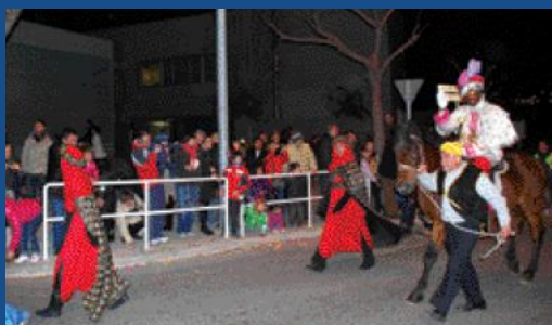
Ses Majestats van arribar a Sant Esteve a cavall.

Llavors, els trabucaires van mostrar la nova carrossa que van construir per a la cavalcada i que portava el personatge infantil Bob el Manetes.