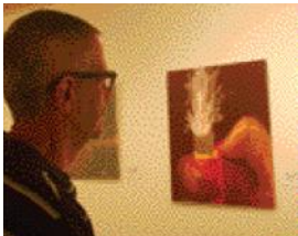
Exposició El Foc a Sant Esteve.

El Casal de Cultura Robert Brillas d'Esplugues de Llobregat va acollir del 10 al 28 de gener les exposicions col·lectives d'Artviu El Foc i Erotisme . La inauguració de la mostra va comptar amb un espectacle a càrrec de les alumnes de l'Escola Municipal de Jazz de Sant Esteve.