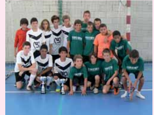
Campionat Futbol Sala Infantil

El FS Sant Esteve ha tirat endavant el Torneig de Festa Major Memorial Joan Pomar, i un 12 d'hores femení i un 12 hores infantil. En noies, les guanyadores va ser el Mataró, mentre que el Sant Esteve va quedar segon. En l'infantil, el Salaet Team es va imposar al FC Sanes.