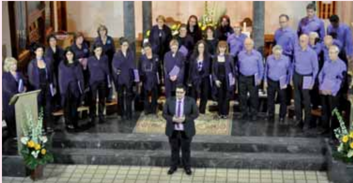
Coral Sant Esteve