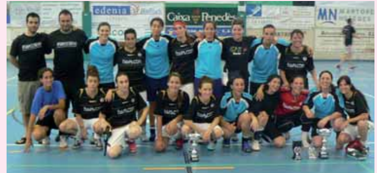
Campionat Futbol Sala Femení

Així mateix, la Festa Major també comptarà amb el 31è TORNEIG INTERNACIONAL D'HANDBOL , pàdel, aquaeròbic, batuka, spinning, bàdminton i escacs, entre altres activitats esportives.