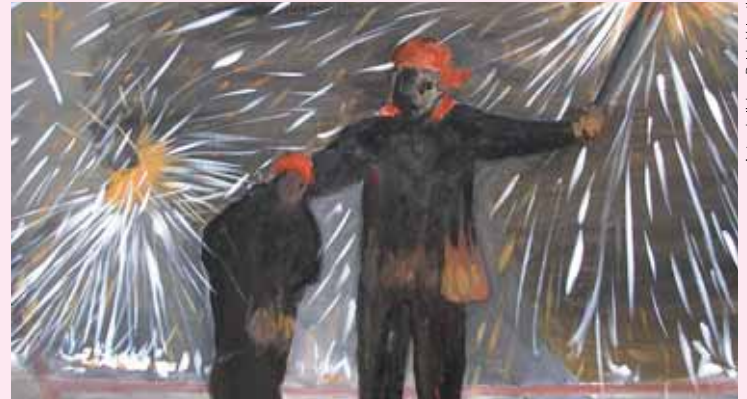
Autor de l'obra: Baldo Valenti

L' art té un espai propi dins de la diversitat d'activitats de la Festa Major. Enguany la proposta artística arriba de la mà d'Artviu. Sota el nom "El Foc", els integrants d'aquest col·lectiu local ens presenten una visió molt personal sobre què els suggereix aquest element, ja sigui des d'un punt de vista físic o una interpretació totalment emocional.