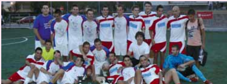
Campionat Futbol 7

El FC Sant Esteve ha estrenat aquest any un campionat de Futbol 7. En la categoria d'adults Rostiseria Lora ha quedat primer i Immobiliària Sesrovires, segon. En infantil-aleví, els finalistes han estat el Mini cubatera (1r) i l'Hortonenc (2n).