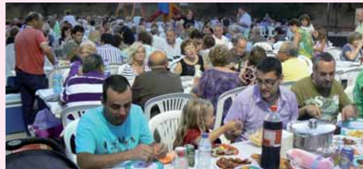
Separ de germanor de Vallserat

E ls barris de Sant Esteve també estan de festa. Can Prats, Vallserat i Ca n'Amat ja han celebrat els seus actes amb una notable presència de públic en les activitats organitzades per les seves respectives associacions de veïns. Els dies 1, 2, 3 i 4 de setembre serà el torn de les festes del nucli veïnal de La Beguda, amb l'espai de l'Envelat com a epicentre de la majoria de les activitats. Més fotos de les festes dels barris a www.sesrovires.cat i al Facebook de l'Ajuntament