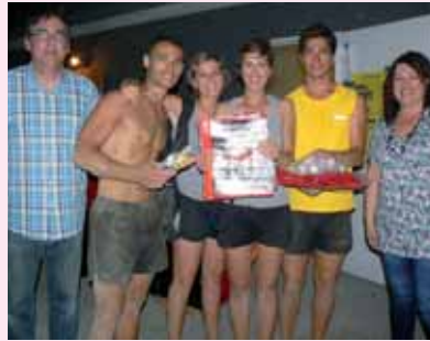
Campionat Vòlei Sorra

El CV Sant Esteve va organitzar amb gran èxit el 3r Torneig de Vòlei Sorra amb la participació de 110 equips i 360 jugadors i jugadores dividits en 12 categories diferents. A més, també ha impulsat el Torneig de Festa Major i un campionat al setembre per acomiadar l'estiu.